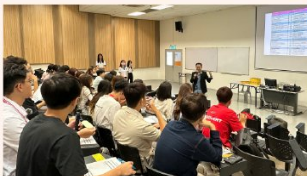
Buổi học chuyên đề tại Đại học Tunku Abdul Rahman (UTAR), Malaysia