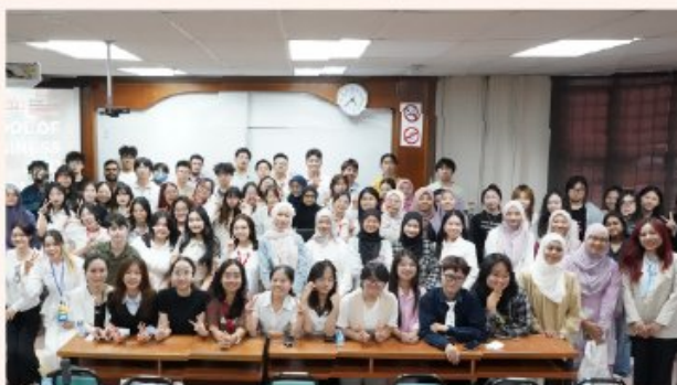
Sinh viên ISB ASEAN Co-op trải nghiệm môi trường học thuật và văn hóa tại Đại học Putra Malaysia (UPM)