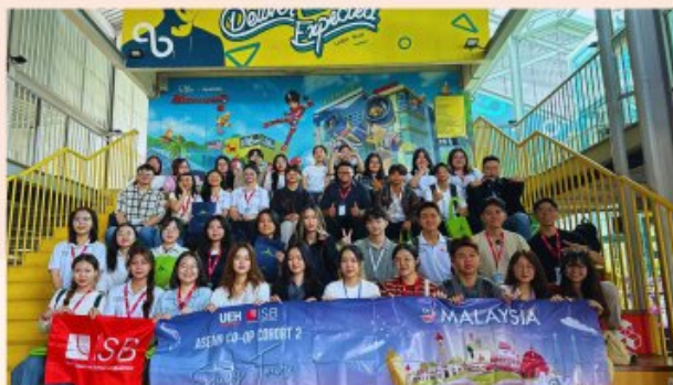
Sinh viên ISB ASEAN Co-op tại Cyberjaya Cyberview Sdn Bhd - "Thành phố công nghệ" của Malaysia