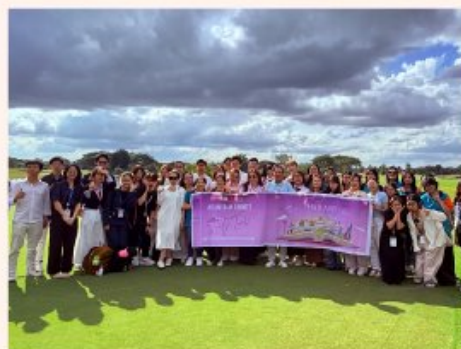
Sinh viên tham quan Singha Park Khon Kaen Golf Club - Mô hình kinh doanh cao cấp do Tập đoàn Singha vận hành