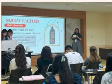
Sinh viên thuyết trình tại Trường Pridi Banomyong International College, Thammasat University (PBIC), Thailand