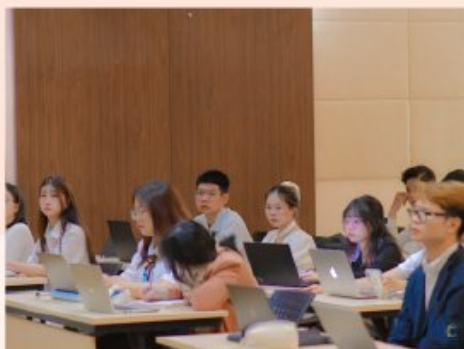
Các bạn sinh viên tham gia một buổi học trong môn International Marketing tại Khon Kaen University International College (KKUIC), Thailand

Chương trình giảng dạy hoàn toàn bằng tiếng Anh, cung cấp hệ thống kiến thức toàn diện từ cơ bản đến chuyên sâu, sẵn sàng cho môi trường học thuật và nghề nghiệp quốc tế. Đồng thời, sinh viên được trải nghiệm môi trường học tập và làm việc trong khu vực ASEAN ngay trong quá trình học tập.